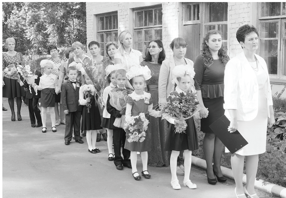
Первосентябрьский праздник в Брыни.