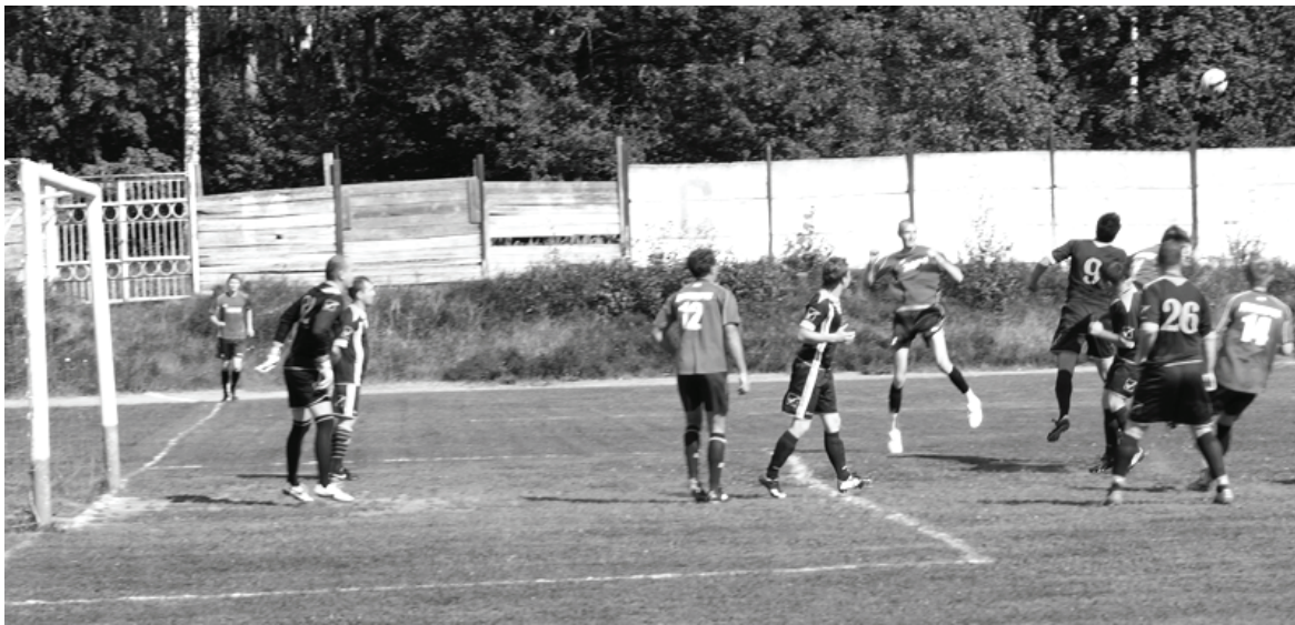
«Заря» атакует и - не забивает.

В следующем туре нас ждет принципиальное противостояние с «Импульсом СПЗ» (Сосенский). Матч состоится на стадионе «Центральный» 10 сентября в 14 часов. До новых футбольных встреч!