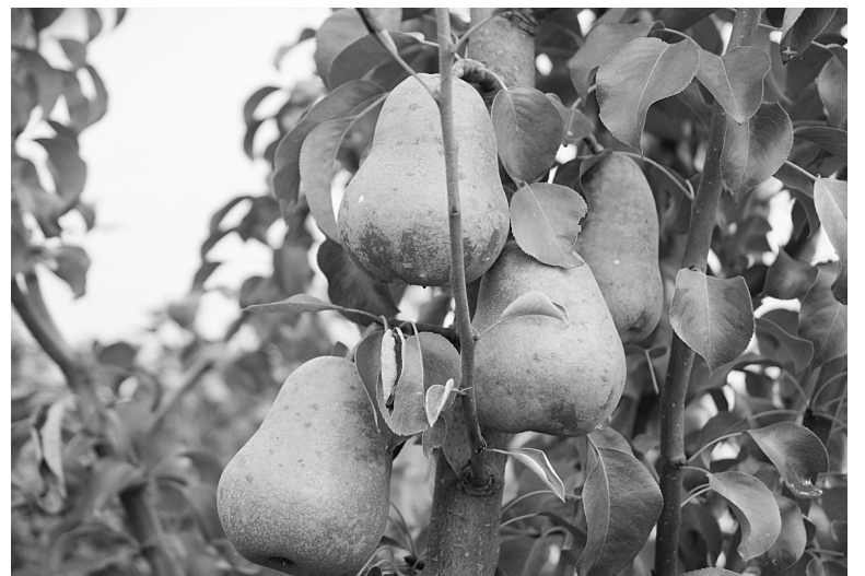
Груши сорта «Лада» очень сладкие.

С ранней весны и до поздней осени на участке Поповых цветущие растения. Я, конечно, поинтересовался названиями. Сезон начинают крокусы, тюльпаны и гиацинты. А